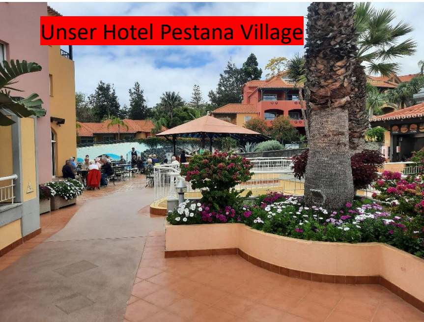
Unser Hotel Pestana Village

MADEIRA – NATUR & GENUSS 2026 + 2027 Funchal, Monte, Porto Moniz, Sao Vincente, Cabo Girao, Curral das Freiras, Barbeitos, Santana, Porto da Cruz, Machico