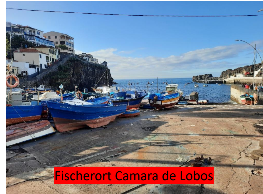
Fischerort Camara de Lobos