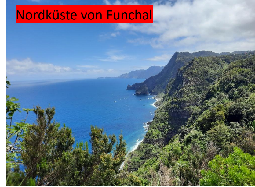
Nordküste von Funchal