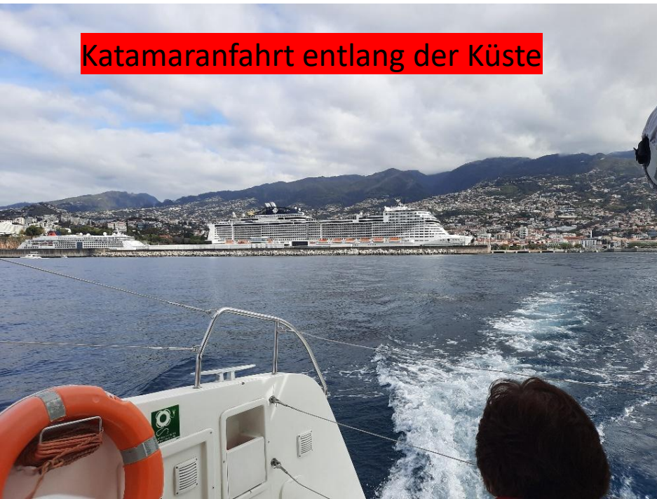
Katamaranfahrt entlang der Küste