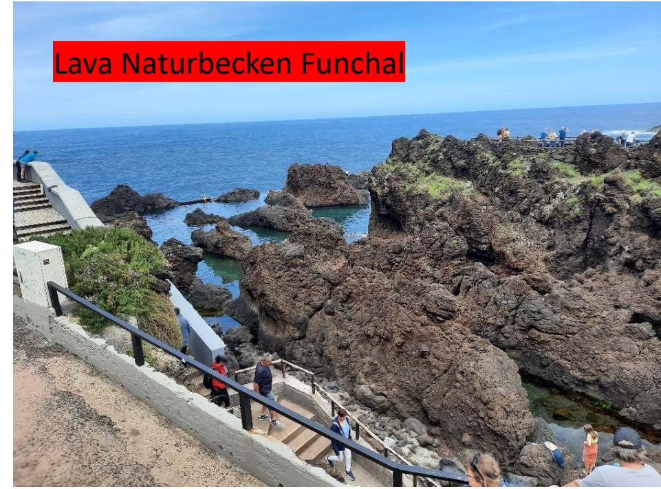
Lava Naturbecken Funchal