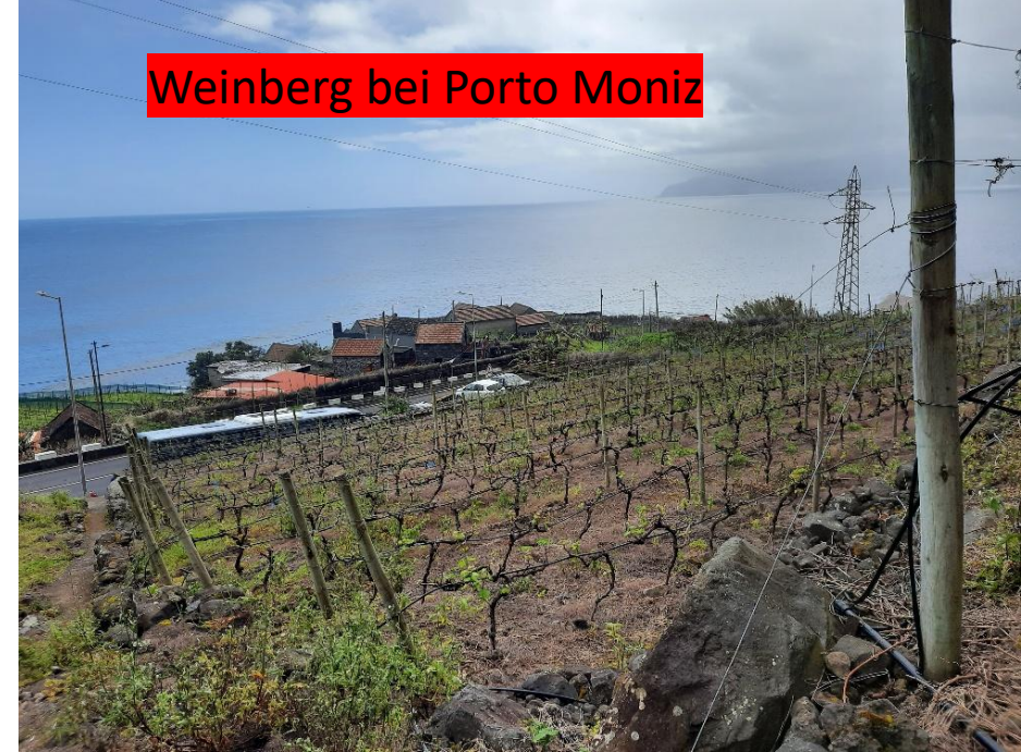
Weinberg bei Porto Moniz

MADEIRA – NATUR & GENUSS 2026 + 2027 Funchal, Monte, Porto Moniz, Sao Vincente, Cabo Girao, Curral das Freiras, Barbeitos, Santana, Porto da Cruz, Machico