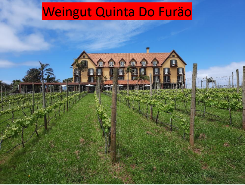
Weingut Quinta Do Furão