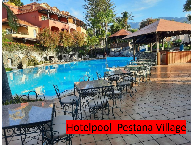
Hotelpool Pestana Village